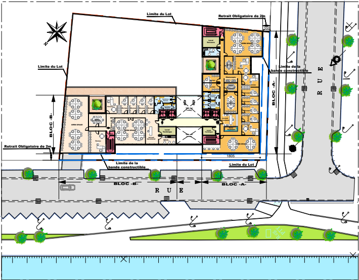
Plan 1 er et 2 ème étage

Par ailleurs de part sa morphologie urbaine, un traitement d'angle s'impose dans le traitement volumétrique du projet. Enfin l'autre donnée majeure c'est la demande du maître d'ouvrage de concevoir deux blocs pouvant offrir à la fois une autonomie fonctionnelle et une possibilité de fusion.