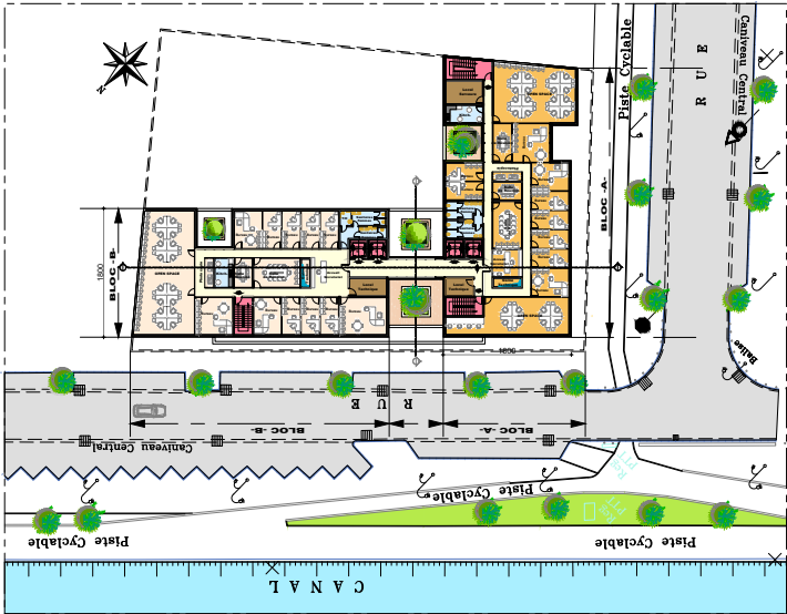
Plan 5 ème étage

Par ailleurs une flexibilité fonctionnelle est requise pouvant répondre aux différents besoins éventuels des futurs exploitants de l'espace. • Face à cette analyse un certain nombre de questions se profile pour nous, comment concevoir une réponse architecturale pouvant répondre aux enjeux de ce contexte urbain ? • Comment concevoir un parti architectural pouvant répondre à l'identité de la Lyre immobilière et quelque part aussi à la maison mère Star assurance ? • Comment assurer un aménagement fonctionnel pouvant répondre aux différentes exigences fonctionnelles des futurs occupants ? • Comment assurer aussi une vie professionnelle pour impulser un esprit d'équipe et une dynamique collective de travail ? Lyre Two est le premier bâtiment qui sera construit dans la partie